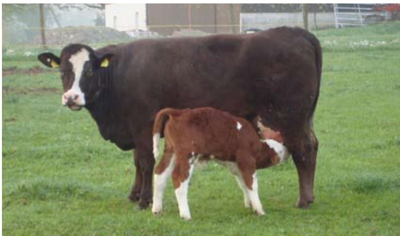
Sandra (F1; Simmentaler x Aberdeen Angus) mit Stierkalb Sano, 10 Tage alt.

Alle Tiere werden gealpt. So bleibt während 100 Tagen im Sommer nur die Raufutterernte zu erledigen. Mit der Alpfung können im Winter mehr Tiere gehalten werden: Die 100 Alptage bringen Meili 30 Prozent mehr Grossvieheinheiten, das ergibt nicht nur 30 Prozent mehr Fleischertrag, sondern auch 30 Prozent mehr tierbezogene Beiträge (Raufutter, RAUS und BTS). Zudem lassen sich durch die Alpfung die Weiden schonen und durch