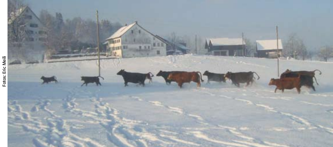
Die Meili-Herde im Winterauslauf. In der Mitte der Limousin-Stier.